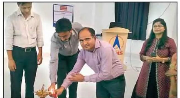
वर्ल्ड फार्मासिस्ट डे पर एपेक्स हॉस्पिटल में कार्यक्रम की शुरुआत करते अतिथि

विश्वामित्र मुनि के कहने पर वह अपने वे मुनि के साथ राम और लक्ष्मण को प